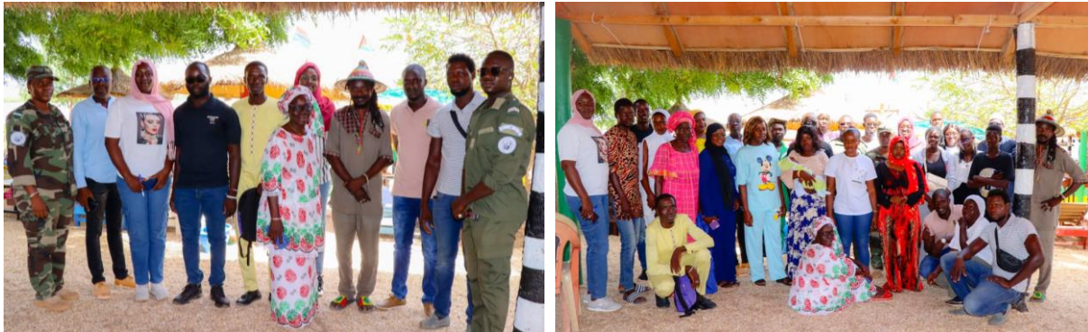
Figure 5 et 6 : Assemblée générale Pôle Petite Cote

Les six pôles régionaux de l'association ont organisé au courant des mois d'octobre et novembre 2023 leurs assemblées générales pour renouveler leurs bureaux respectifs. Ces assemblées générales ont été programmées de manière simultanée avec la célébration de la Journée mondiale des oiseaux migrateurs. Ces rencontres ont permis : (i) de faire les bilans ; (ii) de tirer les enseignements ; (iii) d'ouvrir de nouvelles perspectives qui permettraient de mieux conserver les oiseaux, leurs habitats naturels ; et (iv) et de renouveler les équipes de direction (bureaux) des Pôles régionaux.