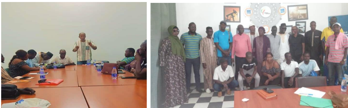
Figure 9 et 10 : Assemblée générale Pôle Nord