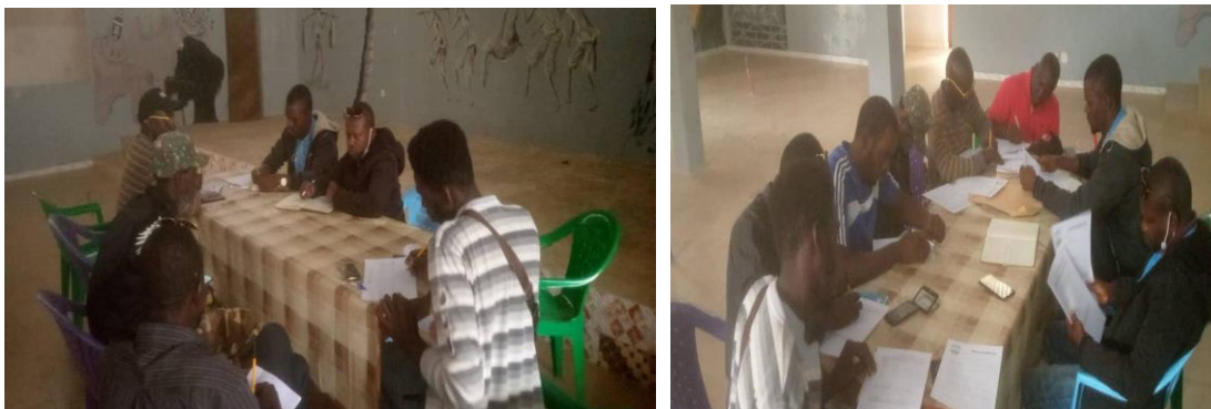
Figure 9 et 10 : mise en place GLS DE Coubalan (Casamance)

Afin de répondre au souci de renforcer le dispositif des équipes de suivi des ZICO (IBA) et du membership, la mise en place de groupes locaux de soutien (GLS) s'est poursuivie au niveau des sites d'intérêt écologique. C'est à ce titre que deux (GLS) ont été créés au niveau de la Réserve Naturelle de Popenguine, et l'Aire Marine Protégée de Niamone Kalounaye, plus précisément à Coubalan le 17 décembre 2023.