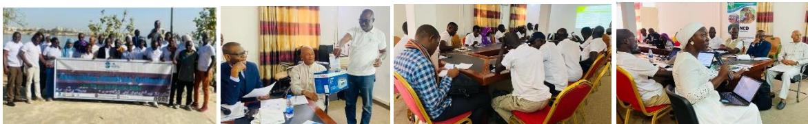
Figure 1, 2, 3, 4 : Assemblée générale Pôle Petite Cote

Dans l'optique d'une bonne gouvernance, les instances de renouvellement de son bureau national, NCD a organisé son 4 ème Assemblée Générale Ordinaire (AGO) de NCD entre le 02 et 04 février 2024 au niveau du Parc National des Iles de la Madeleine (Dakar). Pour rappel, l'AG, la plus haute instance de NCD, est une rencontre statutaire et triennale pendant laquelle tous les représentants des pôles, le bureau exécutif ainsi que le bureau national se réunissent pour faire les bilans d'activités et financiers du mandat écoulé et renouveler l'équipe dirigeante.