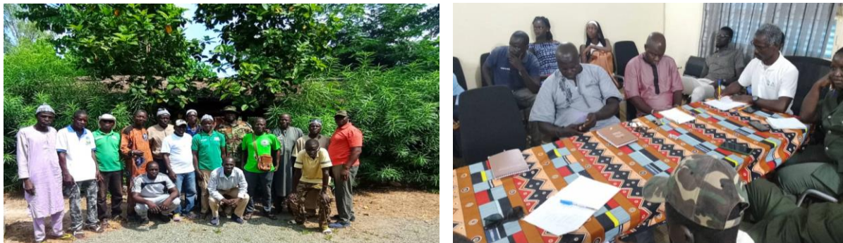
Figure 7 et 8 : Assemblée générale Pôle Casamance et Pôle Niokolo