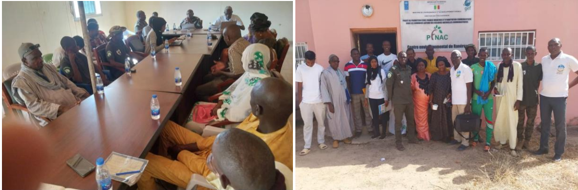
Figure 7 et 8 : Mise en place Pôle Ferlo Novembre 2023

Cette mission a servi de prétexte pour de fédérer les membres du GLS de Koyli Alpha et les acteurs de conservation de Ranérou pour constituer un réseau fort.